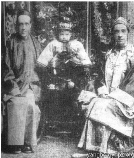
柏格理夫妇和他们的长子