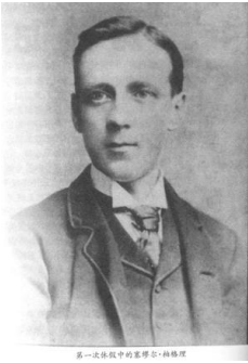
第一位来教中的基督教士-柏格理