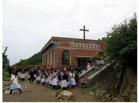
石門坎基督教福音堂